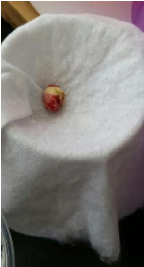
el frijol descubierto se empieza a abrir y a crecer la raiz.